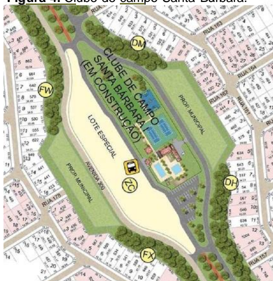
Figura 4. Clube de campo Santa Bárbara.