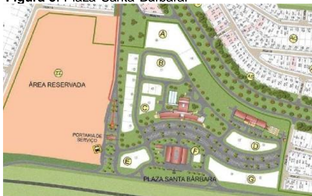
Figura 3. Plaza Santa Bárbara.

Fonte: Imagem da Santa Bárbara Residence Resort. Acesso em 26/04/2022