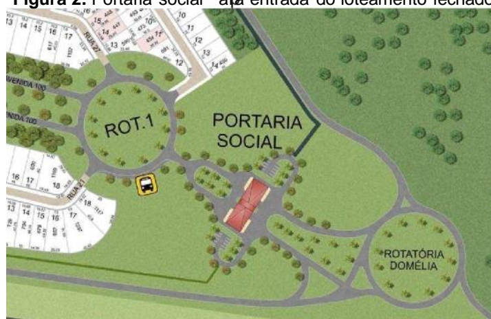
Figura 2. Portaria social para entrada do loteamento fechado.