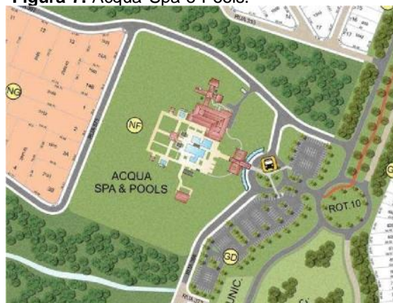
Figura 7. Acqua Spa e Pools.

Fonte: Imagem da Santa Bárbara Residence Resort. Acesso em 26/04/2022