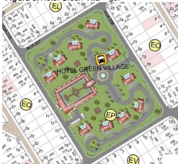
Figura 6. Hotel Green Village ge.