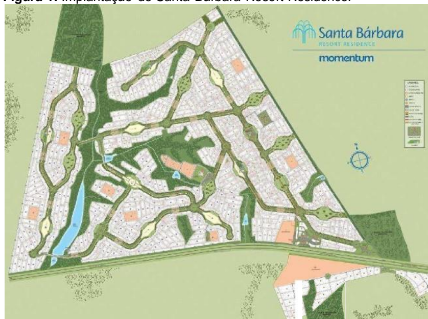
Figura 1. Implantação de Santa Bárbara Resort Residence.