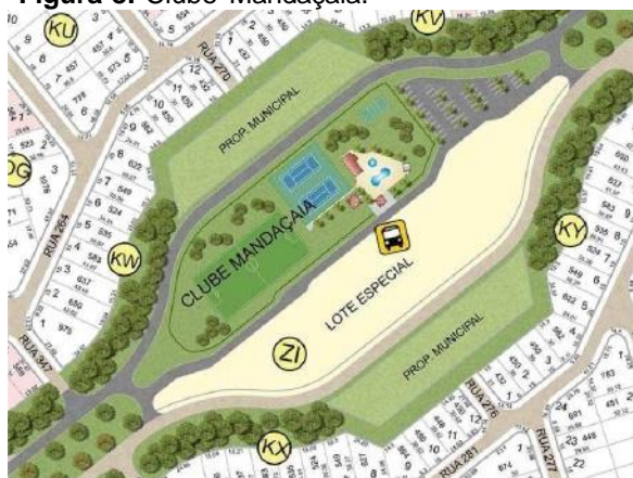
Figura 8. Clube Mandaçaia.

Fonte: Imagem da Santa Bárbara Residence Resort. Acesso em 26/04/2022