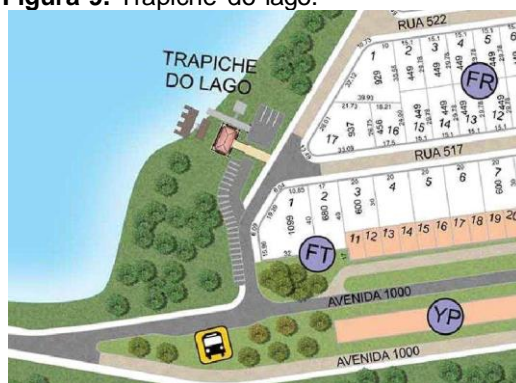
Figura 9. Trapiche do lago.

Fonte: Imagem da Santa Bárbara Residence Resort. Acesso em 26/04/2022