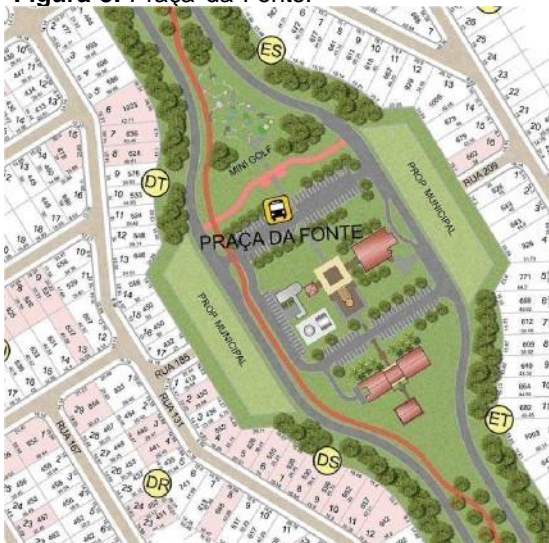
Figura 5. Praça da Fonte.

Fonte: Image'm da Santa Bárbara Residence Resort. Acesso em 26/04/2022