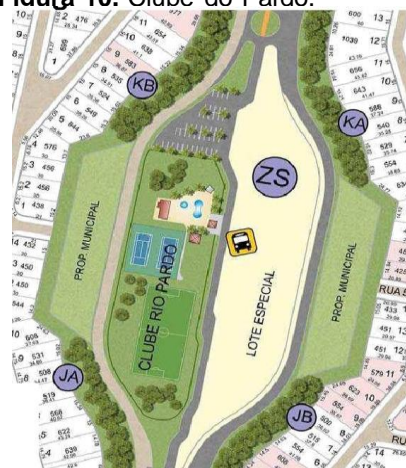
Figura 10. Clube do Pardo.