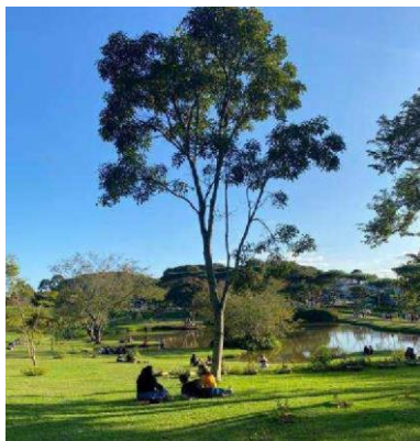
Figura 03- Espaços de lazer.