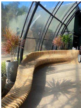
Figura 07 - Projeto de Abrão Assad.