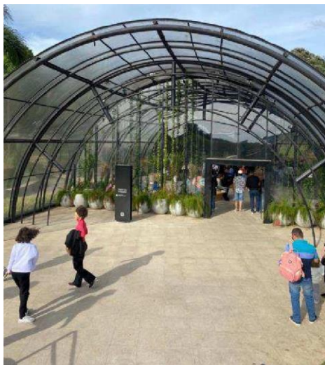
Figura 06 - Entrada do museu botânico.