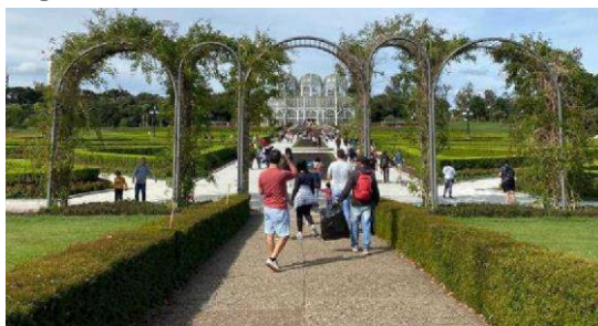
Figura 04- Portal de entrada.