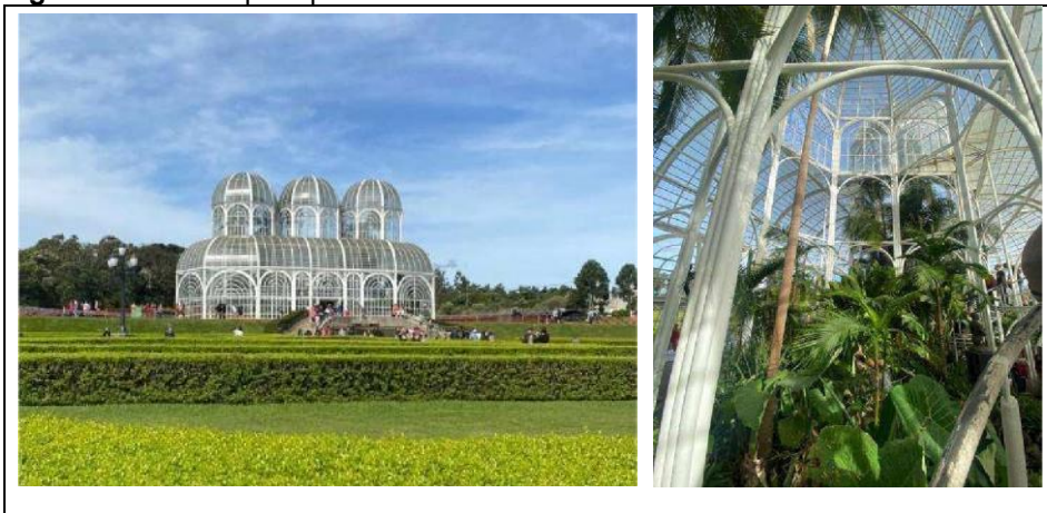
Figura 05: Estufa principal.