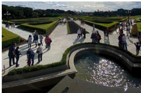
Figura 12 - Jardim francês.