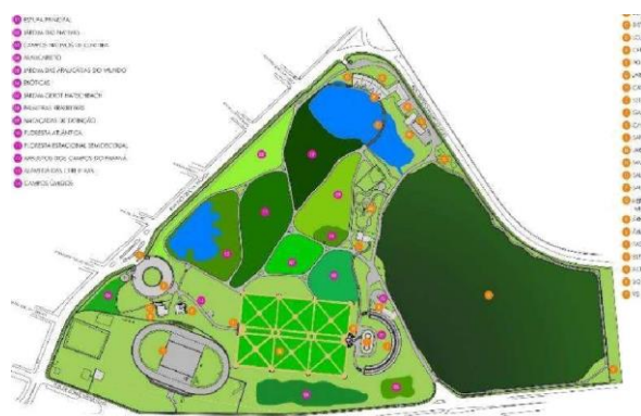
MAPA JARDIM BOTÂNICO