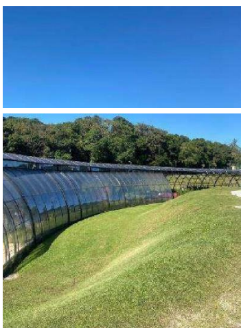
Figura 09 - Cobertura da Galeria das Quatro Estações.

Fonte: Alice de Moraes Cruz - acesso em 23 de abril de 2022 — 14:50h.