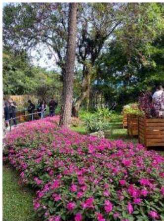
Figura 11 - Exposição de plantas.