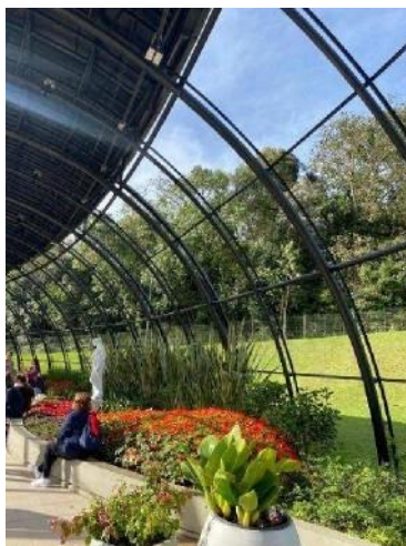
Figura 10 - Jardim canteiro representando as estações do ano.