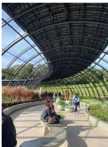
Figura 08: Espaço interno da Galeria das Quatro Estações.