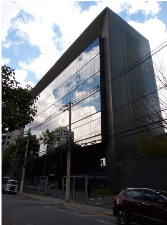
Figura 03. Fachada do prédio.