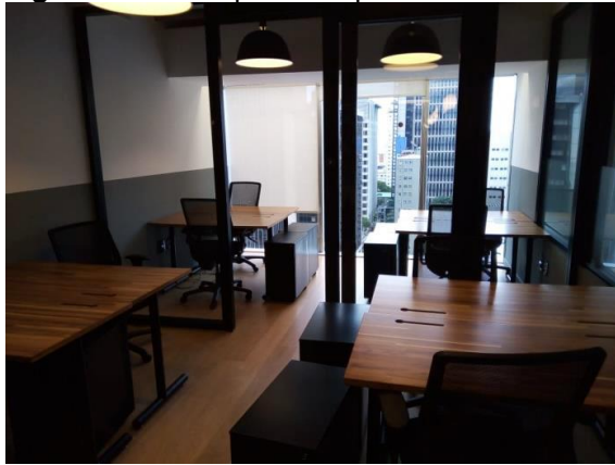
Figura 02 - Sala para oito pessoas.