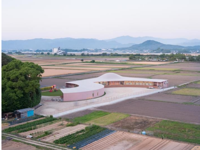
Figura 07 - Vista Aérea da Creche Subaru, Ogori, Japão.