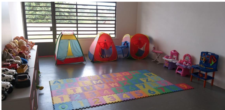
Figura 04. Brinquedoteca da creche Nassib Mofarrej, Irapé – S.P..

É uma sala onde as crianças poderão realizar diversas atividades lúdicas, proporcionando a elas a oportunidade de aprenderem lições para sua vida social, dentro e fora da família, sem mesmo perceberem, pois para eles, é pura diversão. A brincadeira é uma ótima maneira da criança encarar seus medos e angústias e tentar superá-los.