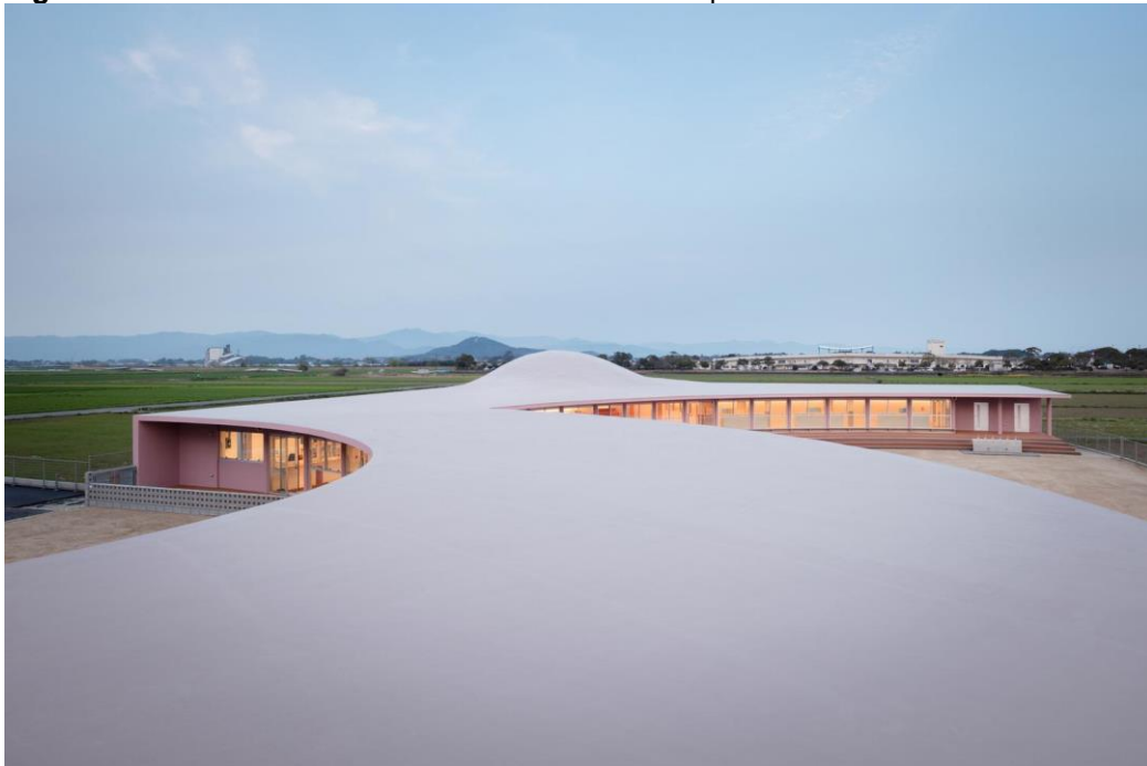
Figura 12. Vista da Cobertura da Creche Subaru comparada às montanhas.

A vista de dentro do edifício, através de suas janelas em fita, faz parecer que as montanhas estão muito próximas.