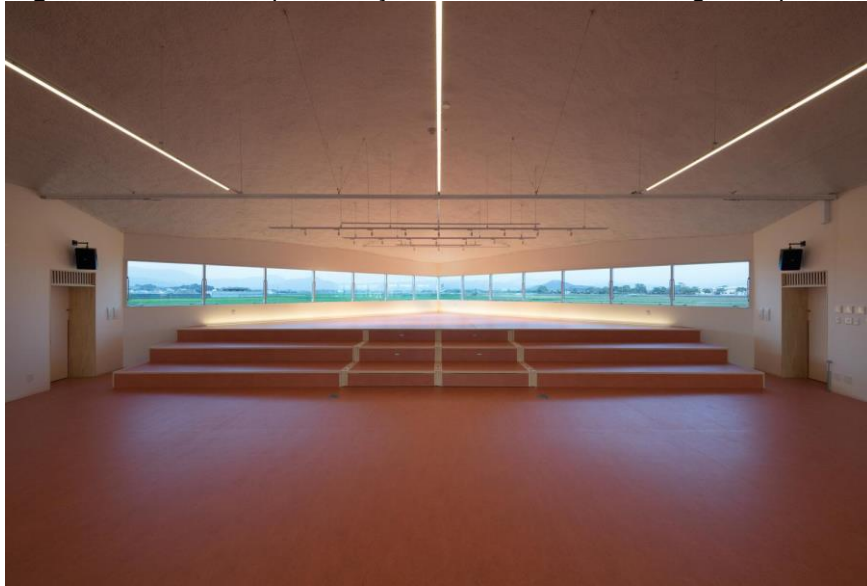
Figura 10. Salão de Apresentações da Creche Subaru, Ogori, Japão.

A creche conta também com um grande salão com um palco elevado, que pode ser utilizado para apresentações de teatros, reunião, etc, seja somente para os alunos, ou também para os pais comparecerem, pois é um espaço bem amplo.