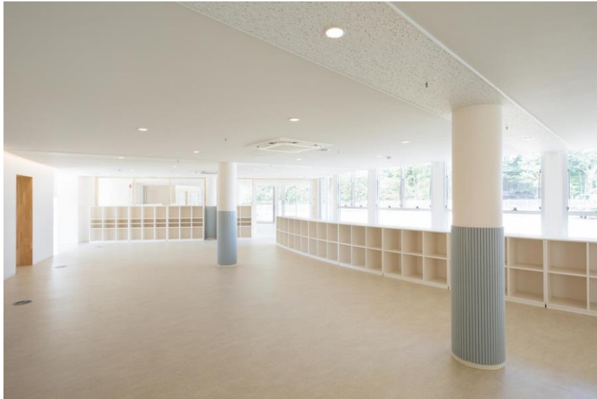
Figura 09 - Sala de Aula da Creche Subaru, Ogori, Japão.

As salas de aulas foram dispostas de modo em que deem acesso direto através de grandes portas aos pátios externos destinados a cada grupo de alunos. A creche enfatiza a importância da atividade física no desenvolvimento dos pequenos, cada jardim externo possui equipamentos adequados a faixa etária das crianças, no dos maiores, possui até uma pista de corrida para incentivá-los a essa prática esportiva, possui também banheiro externo, pois nessa idade, a maioria já consegue ir sozinho. Nos dois espaços externos para as crianças, possuem bebedouros. A única coisa que senti falta foi a de mais brinquedos nesses espaços externos.