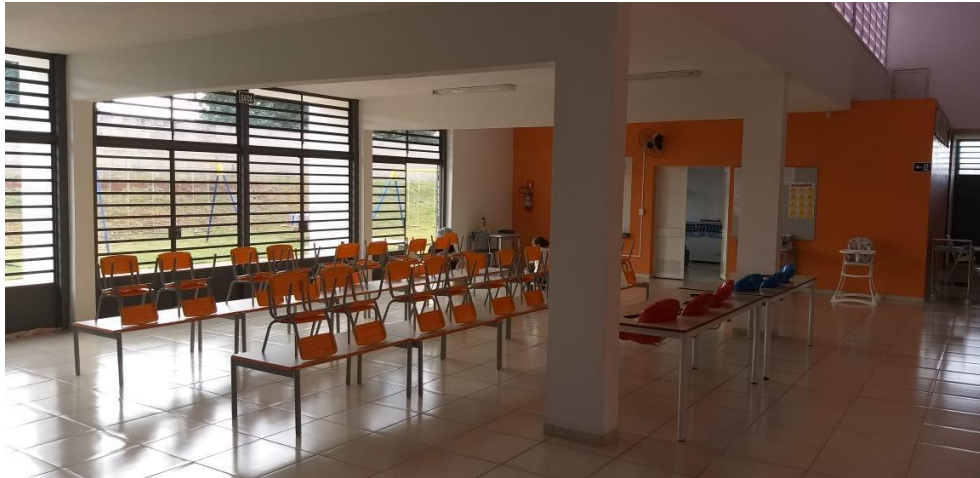
Figura 03 - Refeitório da creche Nassib Mofarrej, Irapé – S.P..