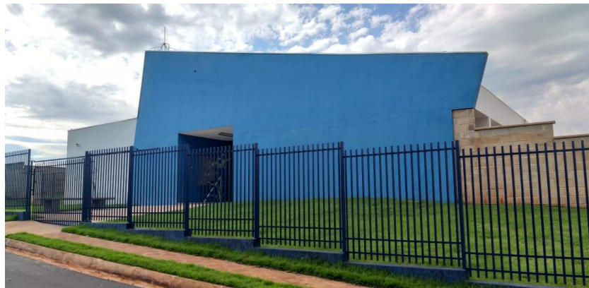
Figura 02 - Fachada da Creche Municipal Nassib Mofarrej, Irapé – S.P.

Segundo Ferrari (2019), em seu TFG, foi realizado um estudo de caso na Creche Municipal Nassib Mofarrej, onde buscou abordar várias questões, como qual o objetivo da construção da creche, onde foi respondido como o de iniciar o contato das crianças desde o berçário de 6 meses até as crianças de 3 anos, sendo uma forma de o município poder ajudar no cuidado das crianças, e as mães possam ficar disponíveis para trabalhar. Foi observado também que o edifício possui uma fachada bem simples, e com pequenas alterações, poderia deixar este “cartão de visita” que é a fachada do edifício, muito mais chamativa, como incluir um letreiro com o nome da creche, e, talvez, criar algum monumento colorido, que possa chamar a atenção dos alunos.