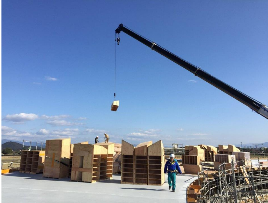
Figura 11 - Execução da Cobertura da Creche Subaru, Ogori, Japão.