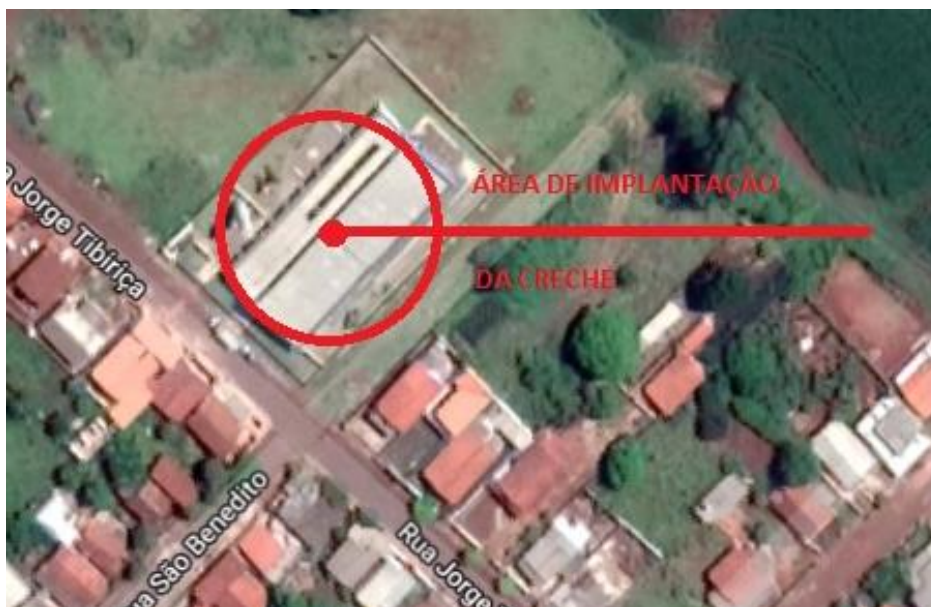
Figura 01 - Mapa de Localização da Creche no Distrito de Irapé – S.P.

A creche fica localizada na Rua Jorge Tibiriça, esquina com a rua São Benedito – Distrito de Irapé – S.P.