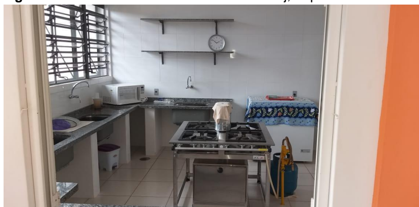
Figura 05 - Cozinha da creche Nassib Mofarrej, Irapé – S.P..

No ambiente da cozinha, pode-se observar que é tudo bem planejado, com os móveis sendo bem perto um do outro, não tendo a necessidade de ser maior, tendo em vista a quantidade de comida que é feita em relação ao número de crianças. É o papel do profissional da saúde e da equipe da creche, garantir que as refeições das crianças sejam seguras e saudáveis. Para isso, a creche conta com uma nutricionista, que dará total assistência à cozinha, montando o cardápio ideal para o crescimento das crianças.