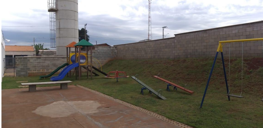
Figura 06. Playground da creche Nassib Mofarrej, Irapé – S.P..