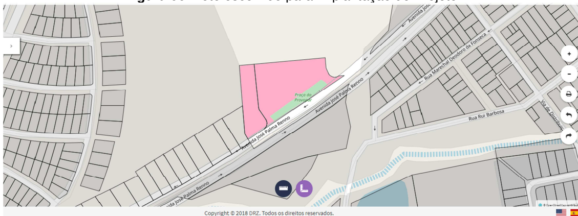
Figura 06: Lote escolhido para Implantação do Projeto.