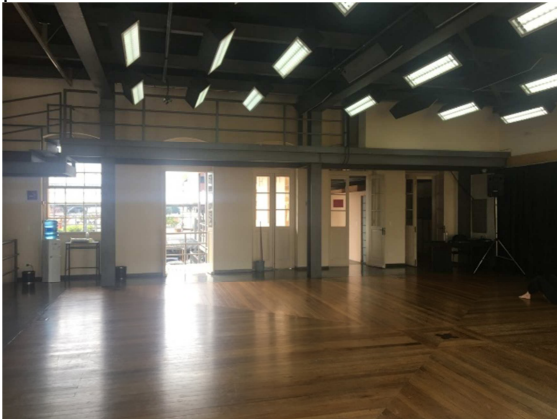
Figura 02: Estúdio de ensaios e apresentações, pavimento térreo.

Fonte: Arquivo Pessoal do Autor. Tirada em 26 de abril de 2019.