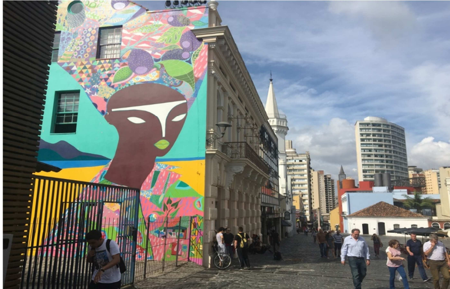
Figura 01: Fachada Lateral Casa Hoffmann – Curitiba/PR

Tirada em: Abril de 2019