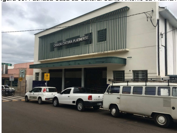
Figura 05: Fachada Casa da Cultura. Santo Antônio da Platina/PR

Fonte: Arquivo Pessoal do Autor. Tirada em maio de 2019.