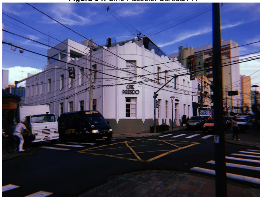
Figura 04: Cine Passeio. Curitiba/PR

Fonte: Arquivo Pessoal do Autor. Tirada em 26 de abril de 2019.