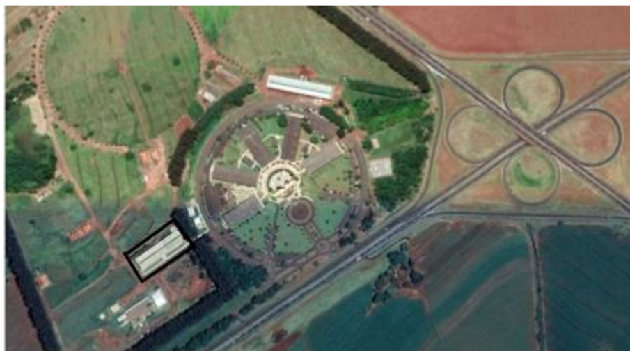
Figura 01. Localização do Hospital Veterinário – Campus da UniFIO.

de cirurgia local de armazenamento, salas de pesquisas, necrotério, entre outras instalações de estudos e apoio, locadas para um bom atendimento.