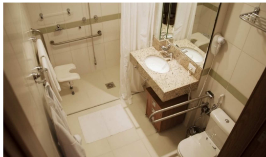
Figura 6 – Banheiro.

Fonte: https://tekhton.com.br/moradias-para-a-terceira-idade/ . Acesso em 31 de agosto de 2019.