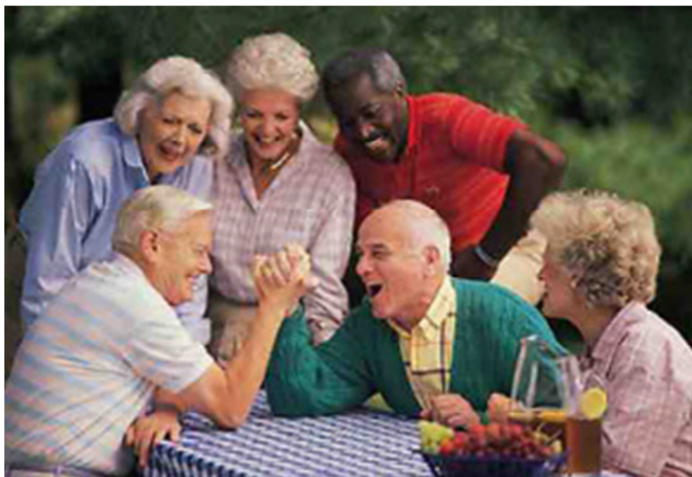
Figura 1 - Encontro de idosos em lazer