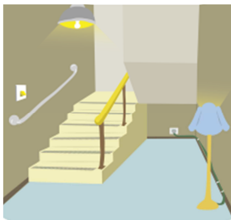
Figura 6: Escada Iluminada.