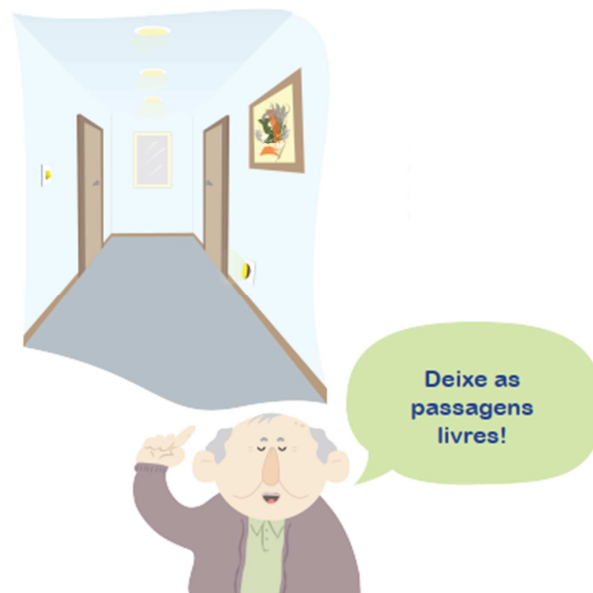
Figura 3: Circulação e Abertura Livres.