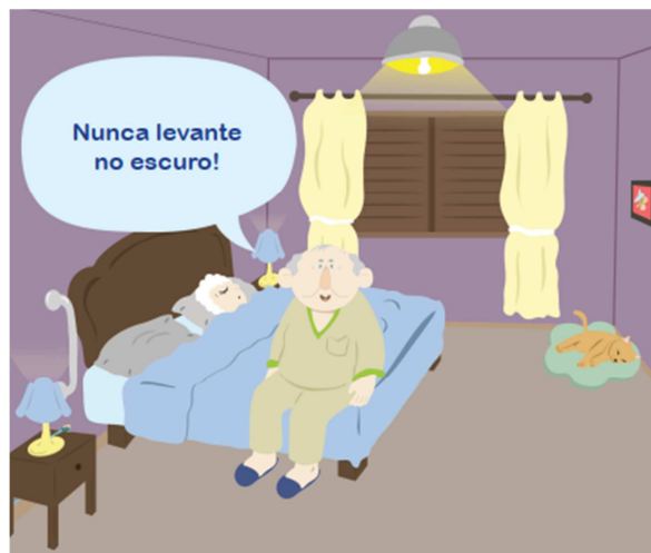
Figura 4: Iluminação Noturna.