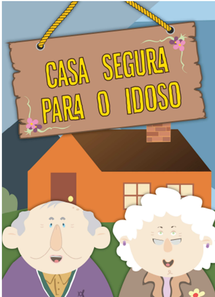
Figura 2: Livro Casa Segura Para o Idoso