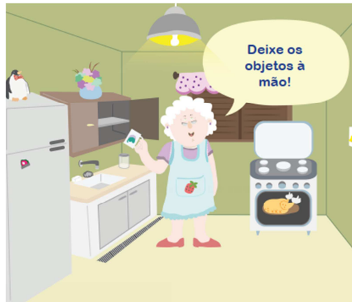
Figura 4: Cozinha.