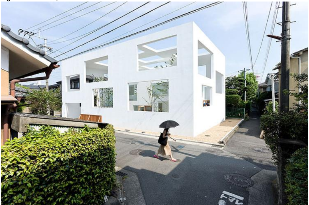
Figura 4 – House N, externa