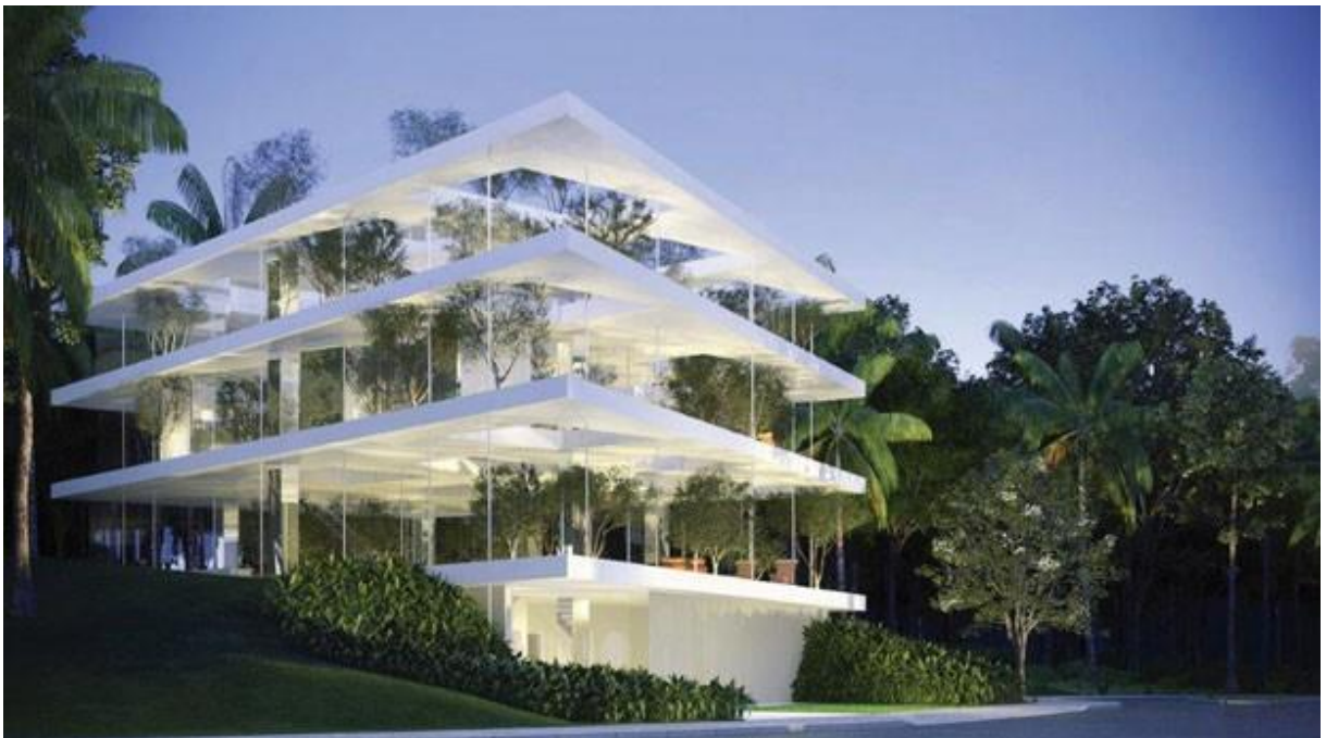
Figura 10 – Projeto em São Paulo