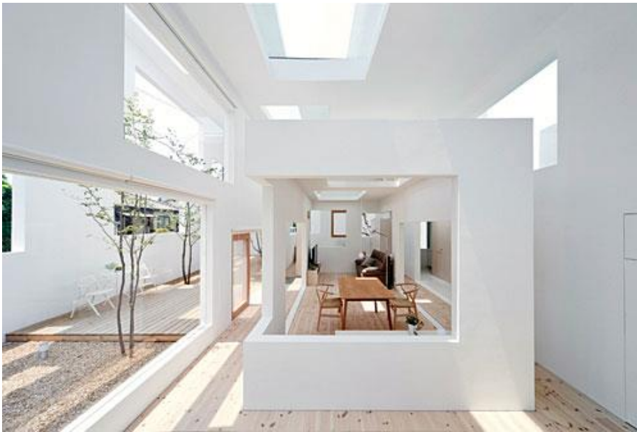
Figura 5 - House N, Interna