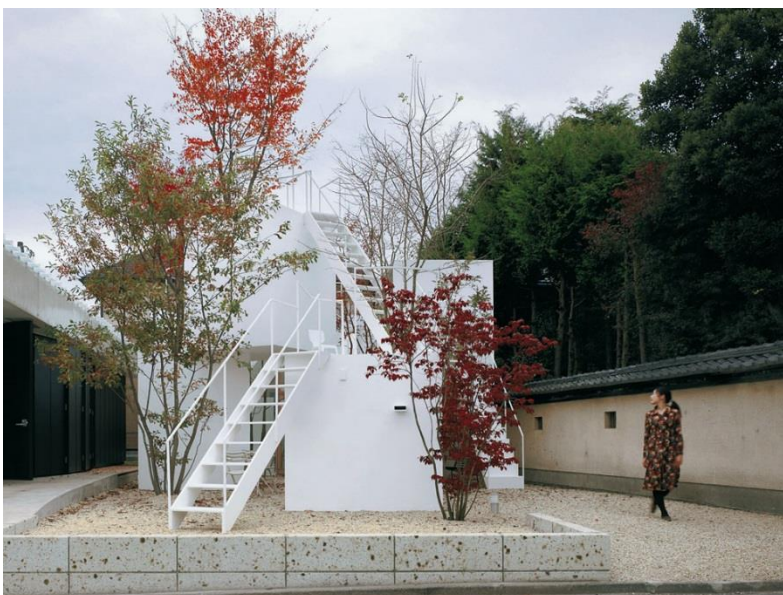
Figura 6 - House Before House