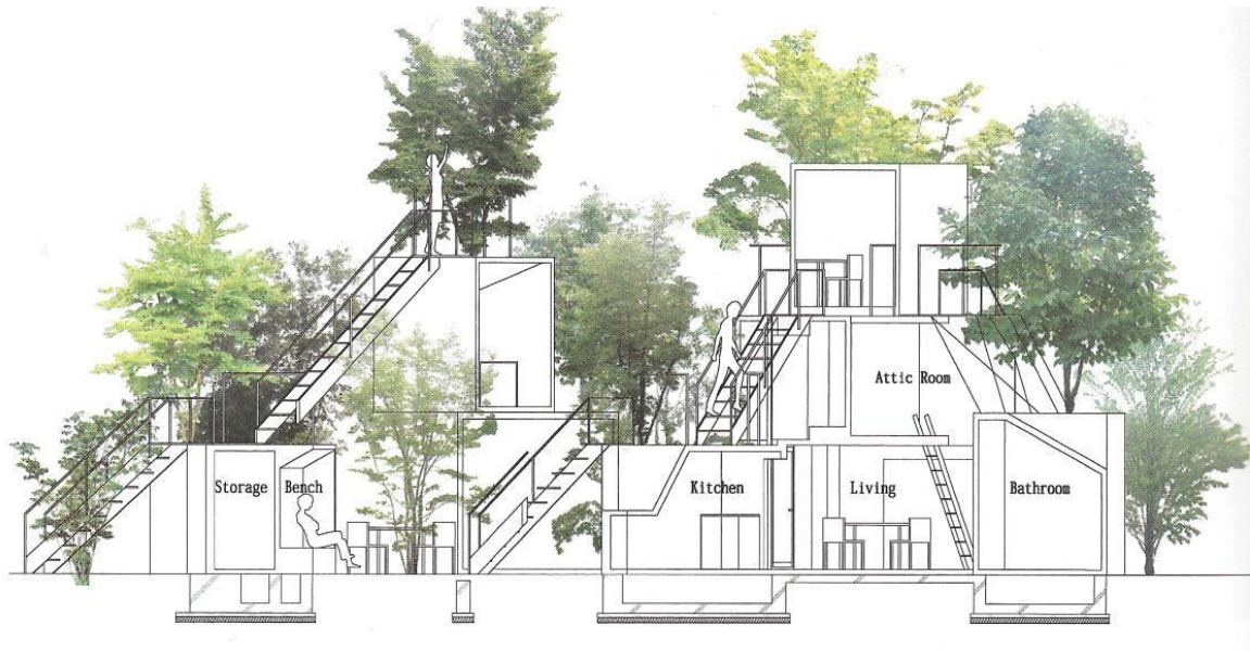
Figura 8 - House Before House corte