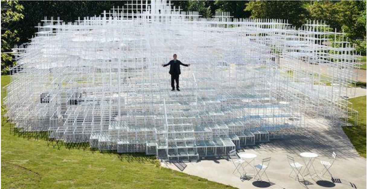
Figura 9 - Serpentine Gallery

Fonte -< http://image.excite.fr/spectacle/foto/serpentine-gallery-a-londres > acessada em 25.03.2018