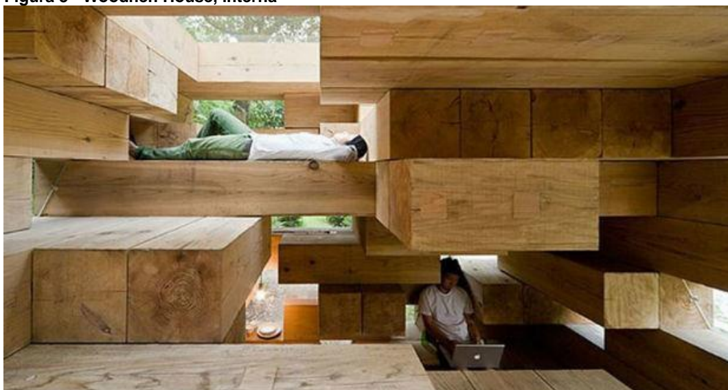
Figura 3 - Woodnen House, interna