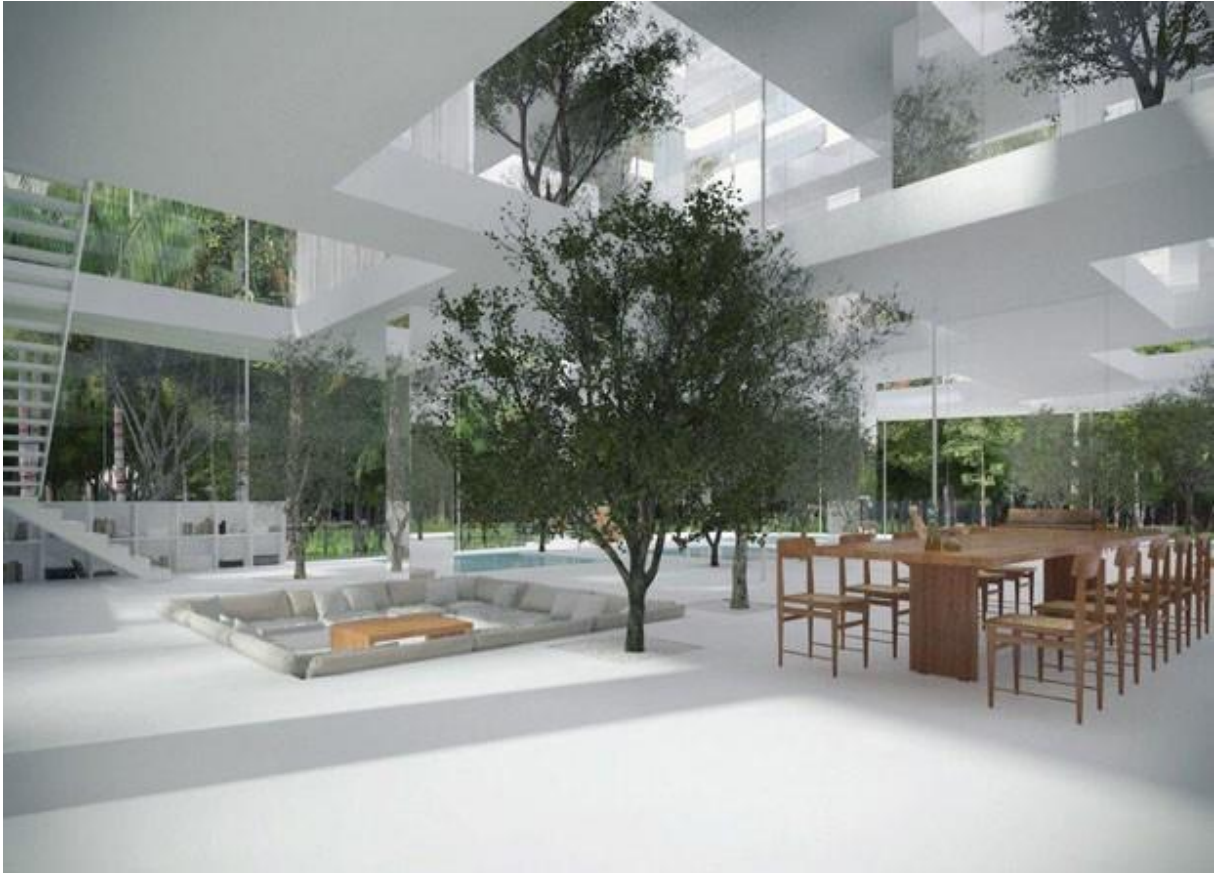
Figura 11 - Projeto em São Paulo