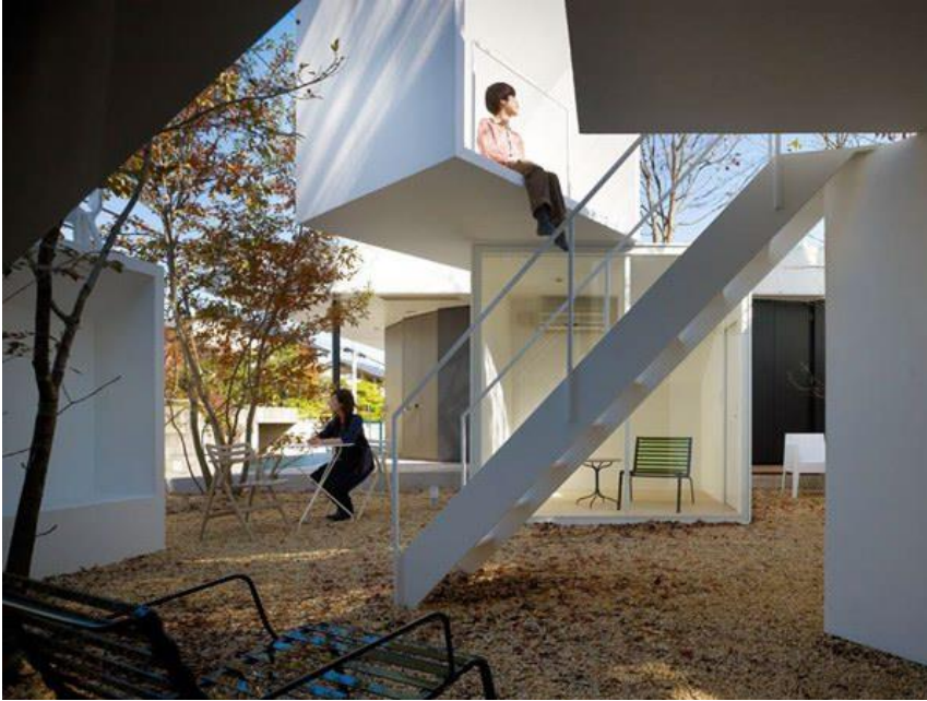
Figura 7 - House Before House interna