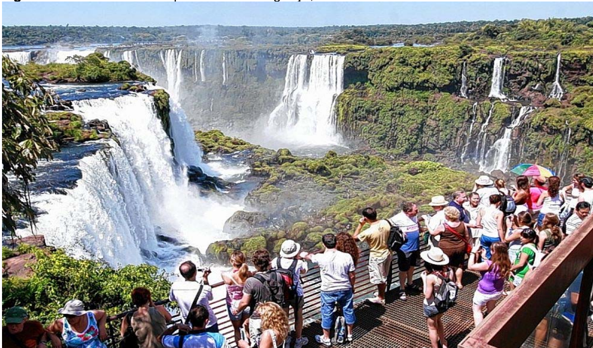
Figura 05. Cataratas do Parque Nacional do Iguazu, Paraná