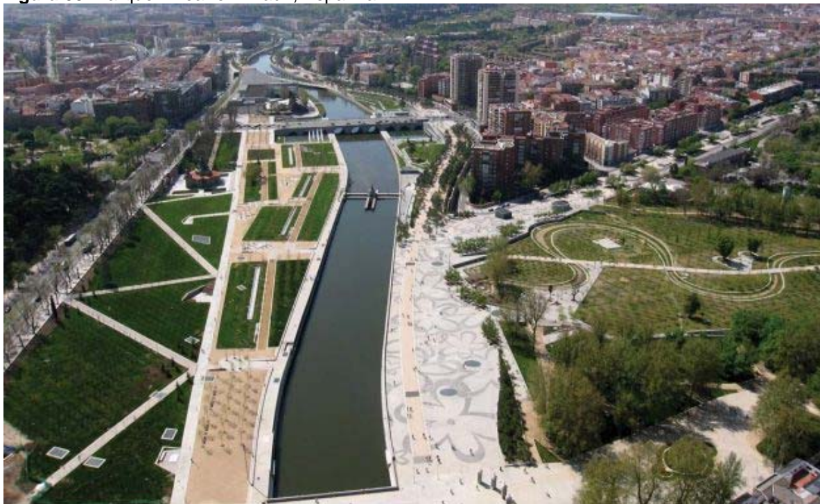
Figura 08. Parque Linear em Madri, Espanha

jovens e adultos, trinta quilômetros de ciclovias, 253 mil metros quadrados de áreas livres, que podem ser usadas para práticas esportivas diversas, 33 mil novas árvores e 429 hectares de zonas verdes. (CICLO VIVO, 2017).