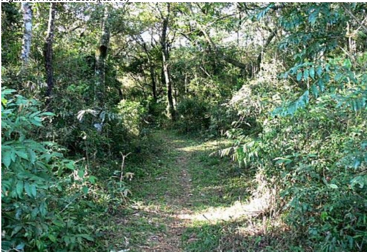
Figura 07. Reserva Ecológica Poty