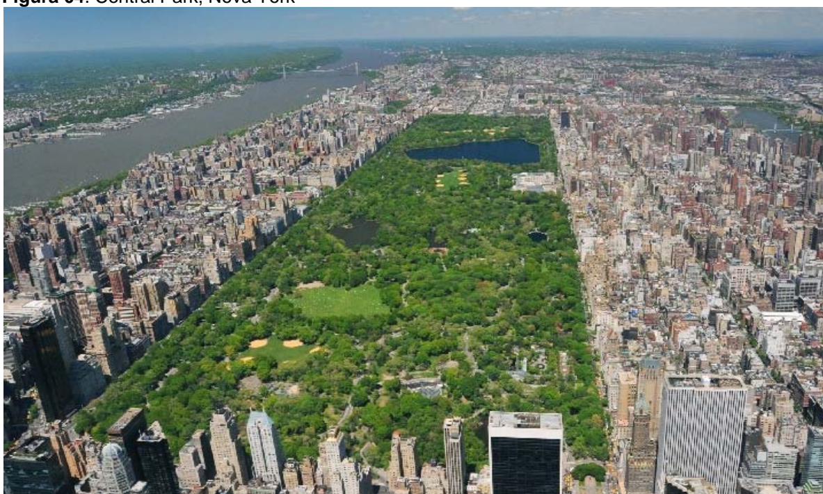
Figura 04. Central Park, Nova York