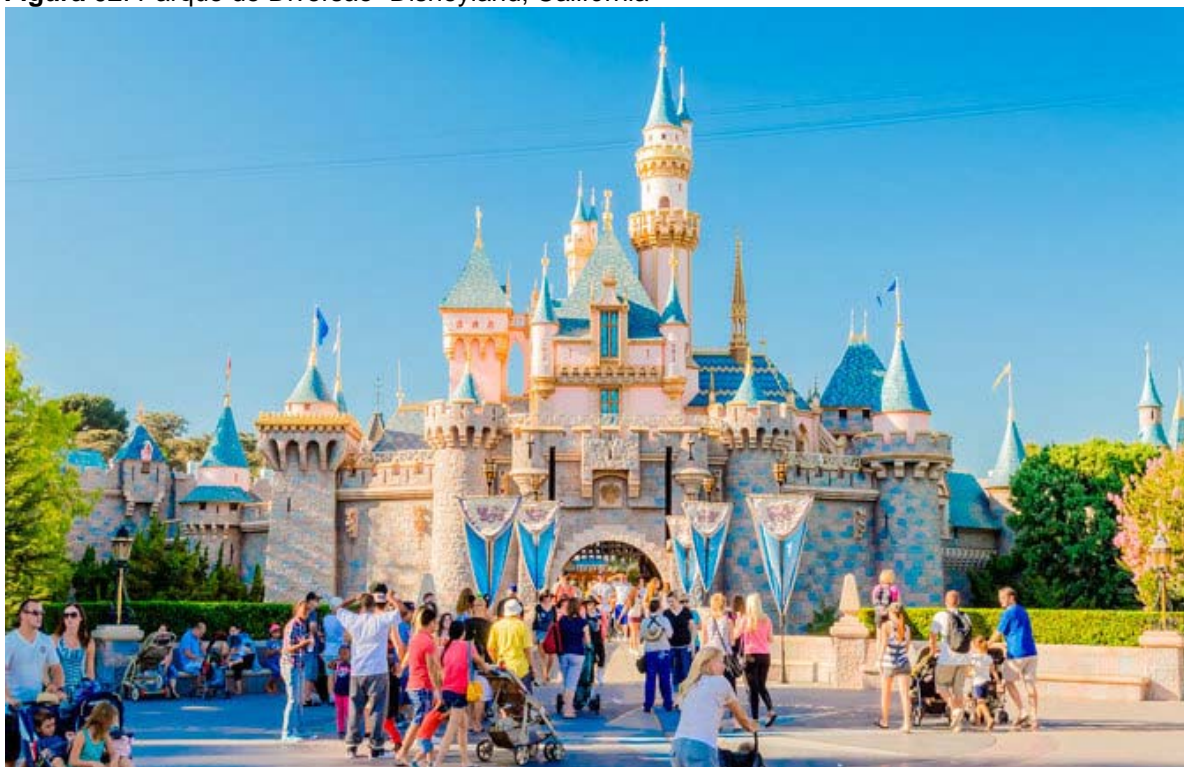
Figura 02. Parque de Diversão- Disneyland, Califórnia

Parques de diversão e parque temáticos podem ser considerados sinônimos, porem existe diferença entre eles. O parque temático possui paisagens, construções e atrações com variados tipos de temas ou historias. Um exemplo bem conhecido é a Disneyland, localizada em Anaheim, Califórnia nos Estados Unidos e foi construído sob o conceito de abranger vários tipos de parques temáticos em um único parque de diversões e foi esse parque que tornou a ideia de parque temático mais popular.