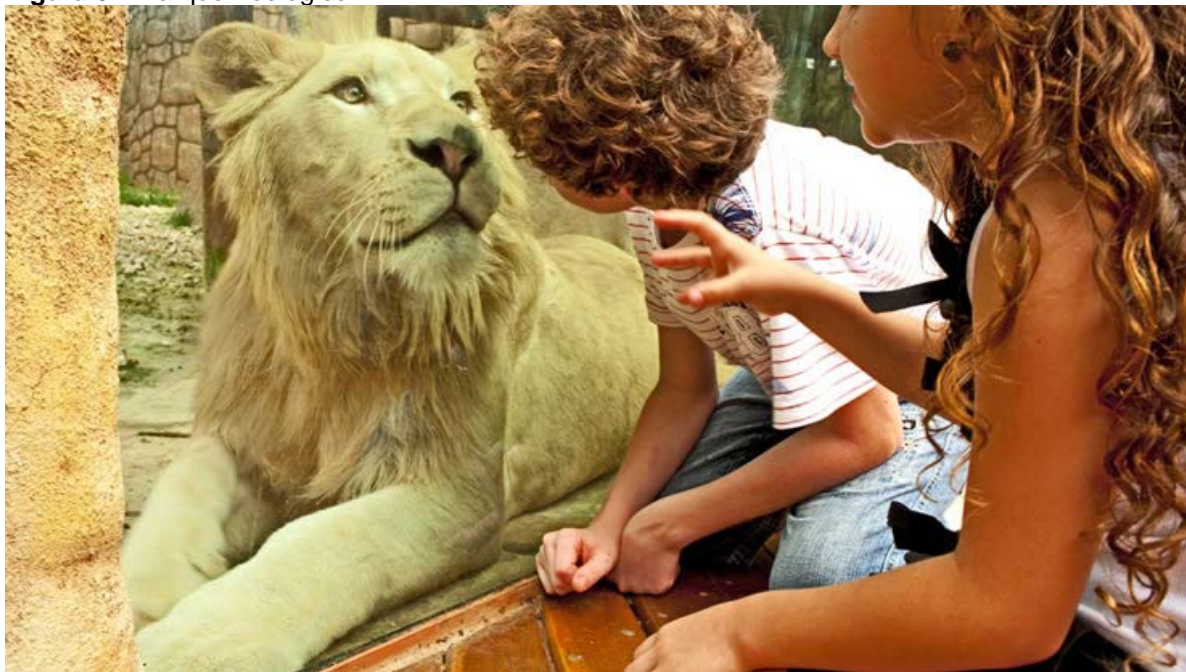
Figura 01. Parque Zoológico

foram passando de poder e diversão para conhecimento e preservação. Atualmente, os zoológicos são responsáveis por garantir a conservação das espécies e conscientizar a população sobre a preservação dos animais, levando em conta suas necessidades físicas e psicológicas. (DIAS - Impacto ambiental, acesso em 31 jun. 2017).