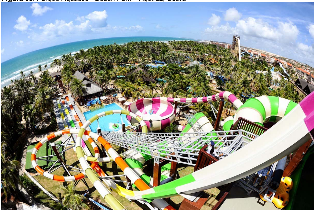
Figura 03. Parque Aquático - Beach Park – Aquiraz, Ceará

No estado do Ceará, na cidade de Porto das Dunas, Aquiraz, existe o Beach Park – Parque aquático que contem diversas atrações para as crianças, atrações para as famílias e até radicais, com brinquedos que podemos chegar a 60 km por hora. Todos os brinquedos contêm salva-vidas treinados e certificados, prontos a postos para qualquer eventualidade. O parque também possui serviços, como espaços de cabanas, que entre uma diversão e outra, os clientes podem estar descansando, saunas com opções de seca ou a vapor, e também contêm seis restaurantes distribuídos por todo o parque.