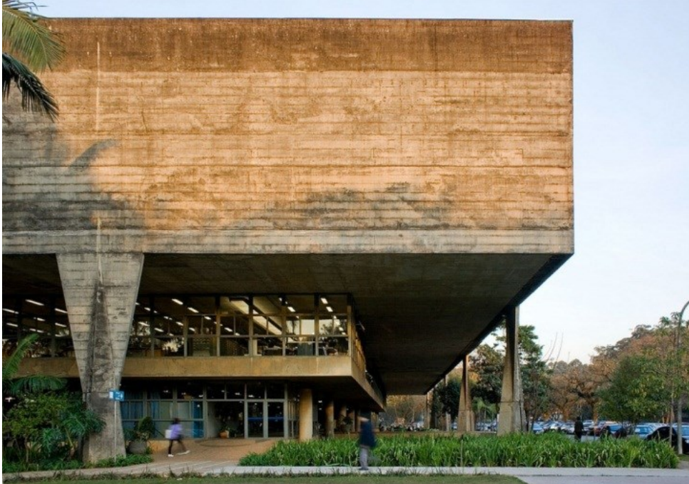
Figura 01. Faculdade de Arquitetura e Urbanismo (FAU – USP).

Dentre as referências projetuais estão os Arquitetos João Batista Vilanova Artigas, dando ênfase a sua obra que abriga a FAU (Figura 01) no campus da Universidade de São Paulo e o Ruy Ohtake, com a obra realizada em Heliópolis hoje denominada de CEU (Figura 02).