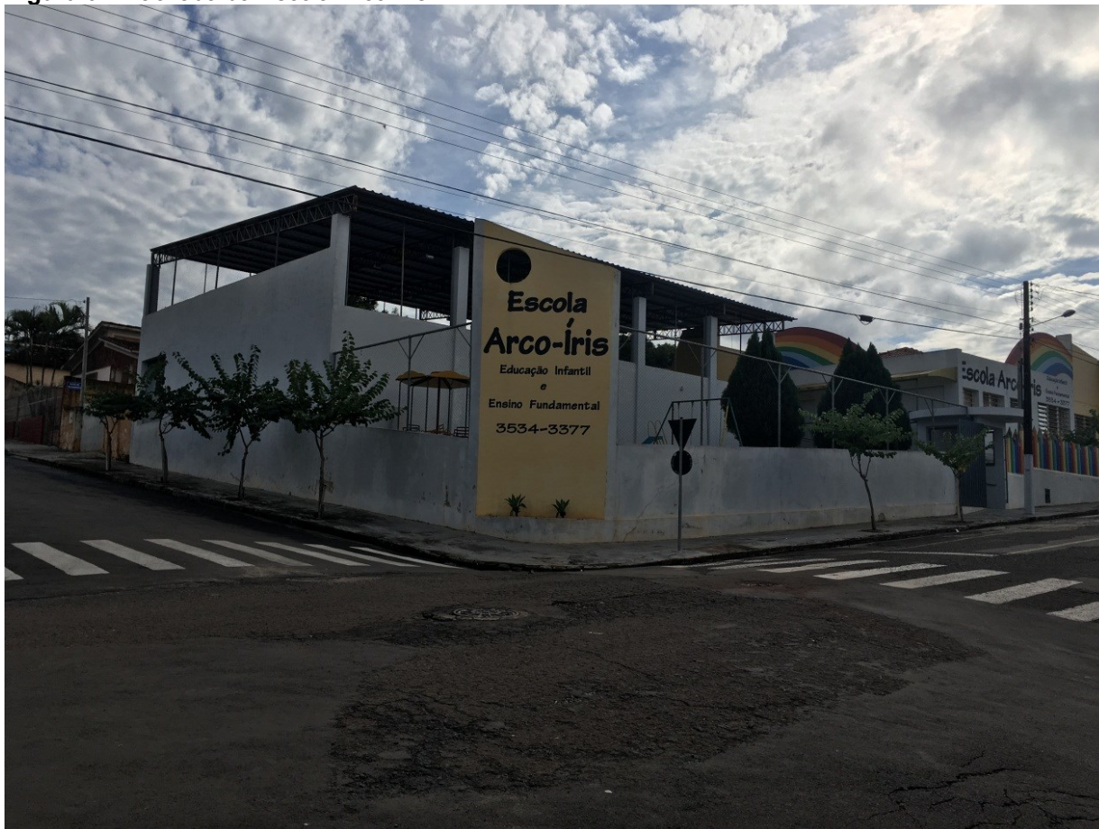
Figura 04. Fachada da Escola Arco-Íris.