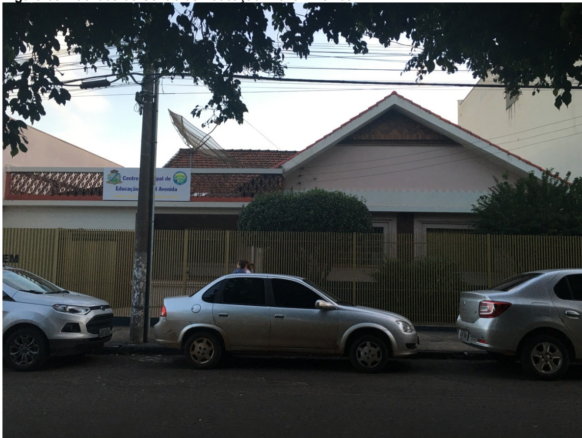
Figura 03. Fachada do Centro de Educação Infantil Avenida

serão necessária para a elaboração de um projeto que supra toda essas necessidades.