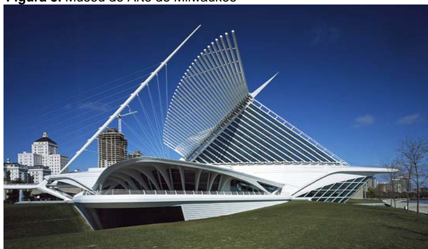
Figura 3. Museu de Arte de Milwaukee