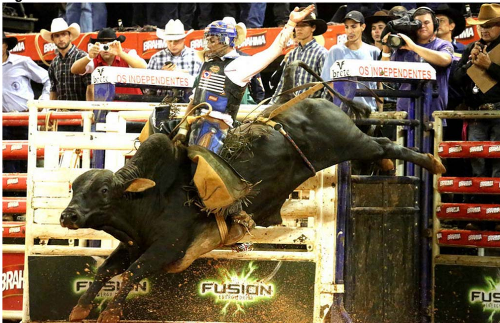
Figura 1. Rodeio Barretos