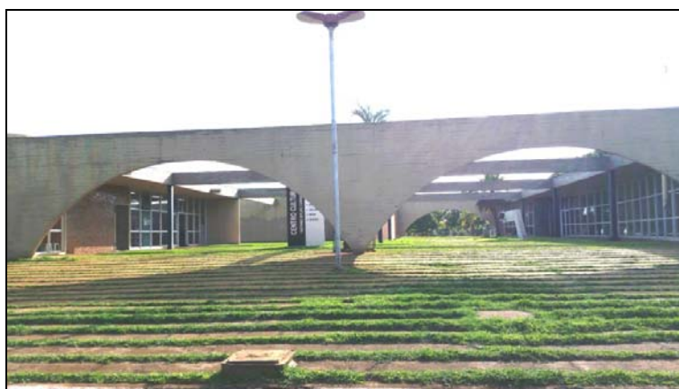
Figura 05. Fachada.

O segundo estudo de caso foi o Centro Cultural Antônio Sylvio Cunha Bueno, localizado em Palmital/SP na Avenida Oriente, com uma área total do terreno de 7.153,72m 2 , e área construída de 1.608 m 2 . Projetado por Ruy Ohtake. Contendo salão de exposições, secretaria anfiteatro, concha acústica, biblioteca, sala de dança e concha acústica. O prédio é um quadrilátero com vigas dispostas de 10 em 10 metros. O auditório, a biblioteca e o salão de arte são três volumes fechados dentro desse quadriculado. Com três acessos feitos em forma de arcos.