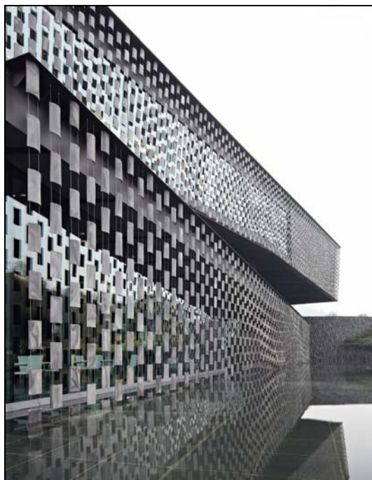
Figura 02. Detalhe Telha.