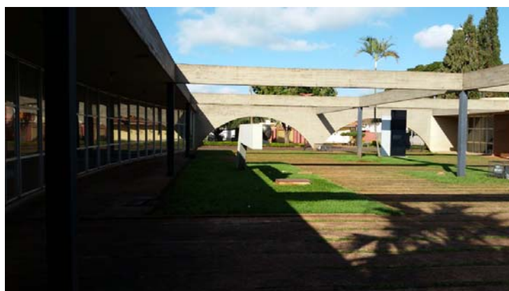
Figura 06. Pátio.