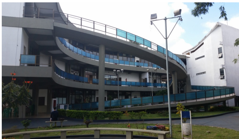
Figura 04. Vista de Costa para o Estacionamento.