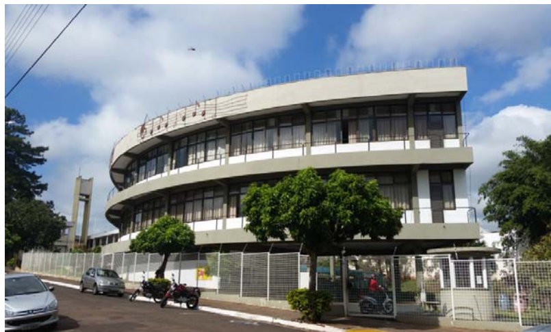
Figura 03. Centro Cultural Tom Jobim.