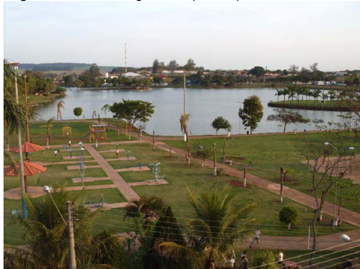
Figura 5. Ponto 3, Lago Municipal de Ipaussu/SP.

O Lago Municipal é o ponto 3 (figura 2 e 5). É ponto turístico da cidade, além de ser área de lazer. Alguns habitantes da cidade realizam pesca para fins alimentícios.