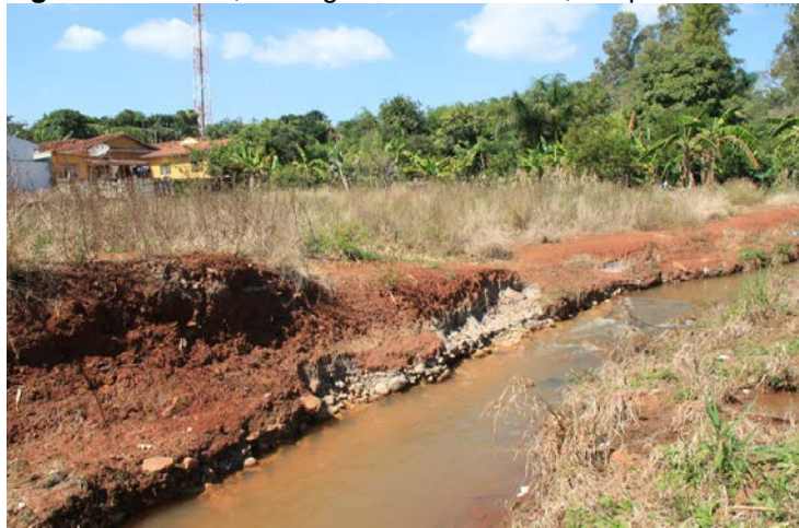
Figura 9. Ponto 6, Córrego Santa Hermínia, de Ipaussu/SP.