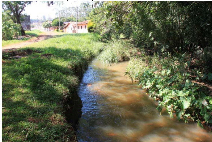
Figura 7. Ponto 5, Córrego Bela Vista, área urbana no município de Ipaussu/SP

O quinto ponto refere-se a um local intermediário do Córrego Bela Vista e está localizado no centro urbano (figura 2 e 7).