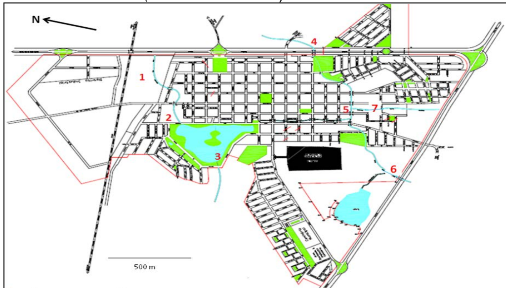
Figura 2. Mapa da zona urbana de Ipaussu/SP com as 7 estações de coleta demarcadas (números em vermelho).