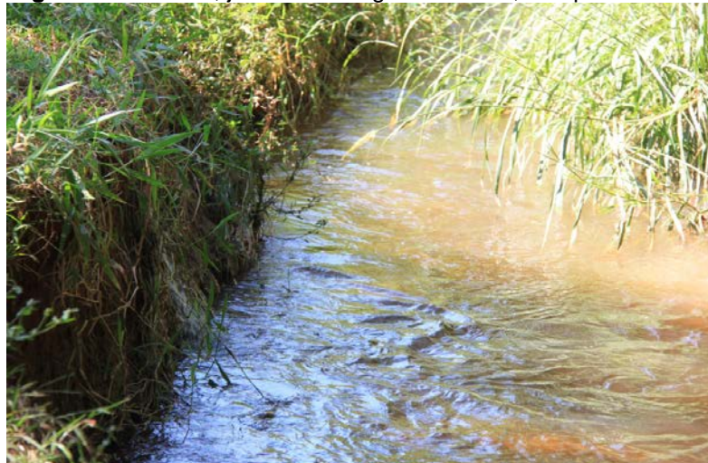
Figura 10- Ponto 7, jusante Córrego Bela Vista, em Ipaussu/SP.

O último ponto é o 7 referindo-se ao término do Córrego Bela Vista no final do trajeto urbano (figura 2 e 10).