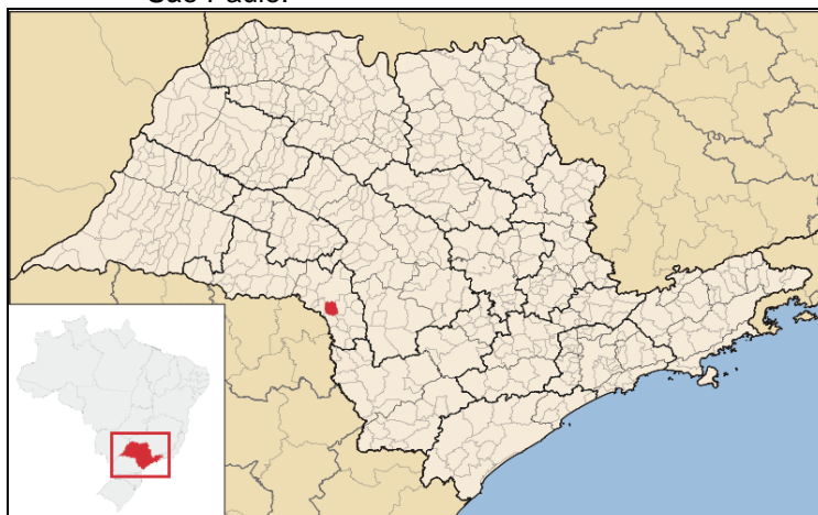
Figura 1. Localização do município de Ipaussu, no Estado de São Paulo.