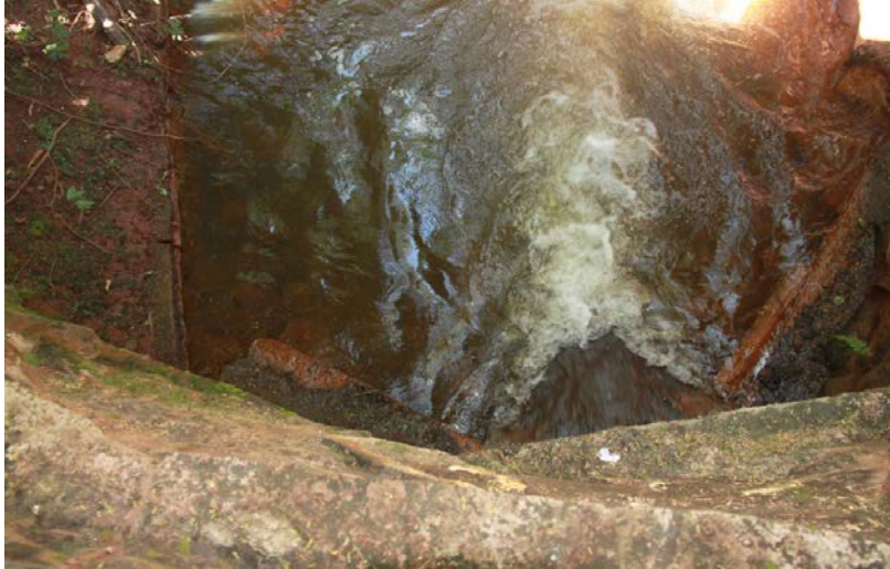
Figura 6. Ponto 4, montante Córrego Bela Vista em Ipaussu/SP.