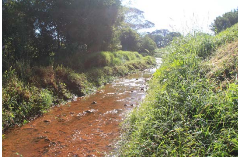
Figura 4. Ponto 2, Córrego São Luiz no município de Ipaussu/SP.

O ponto 2 é no córrego São Luiz, que recebe águas da nascente avaliada no ponto 1. Este córrego atravessa parte da cidade desaguando no lago municipal. Tem habitações humanas em suas margens (figura 2 e 4).