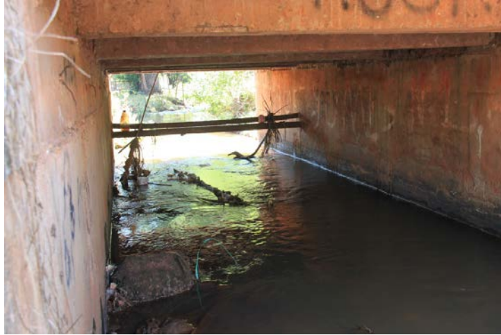
Figura 8. Ponto 6, Córrego Santa Hermínia em Ipaussu/SP.