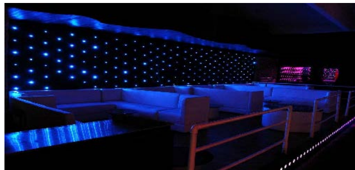
Figura 3 e 4– Interior da Kiss & Fly