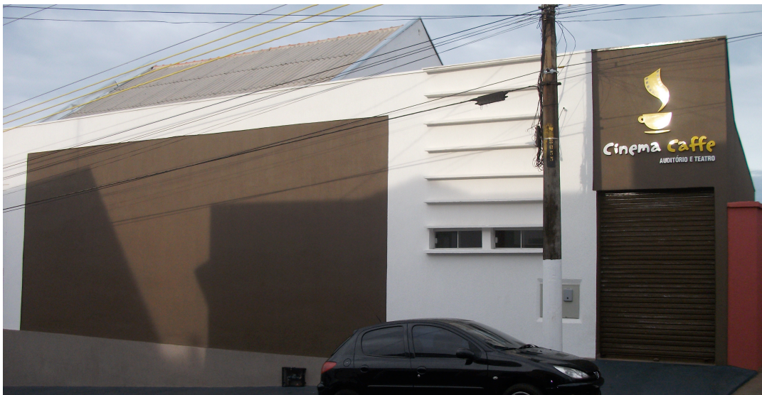
Imagem 1. Fachada Principal do Cinema Caffé.