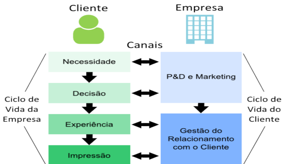
Figura 2 (Modelo de comportamento do cliente)

Kotler, Hayes e Bloom (2002, p. 17), comentam sobre o cliente “participa” do processo de produção: